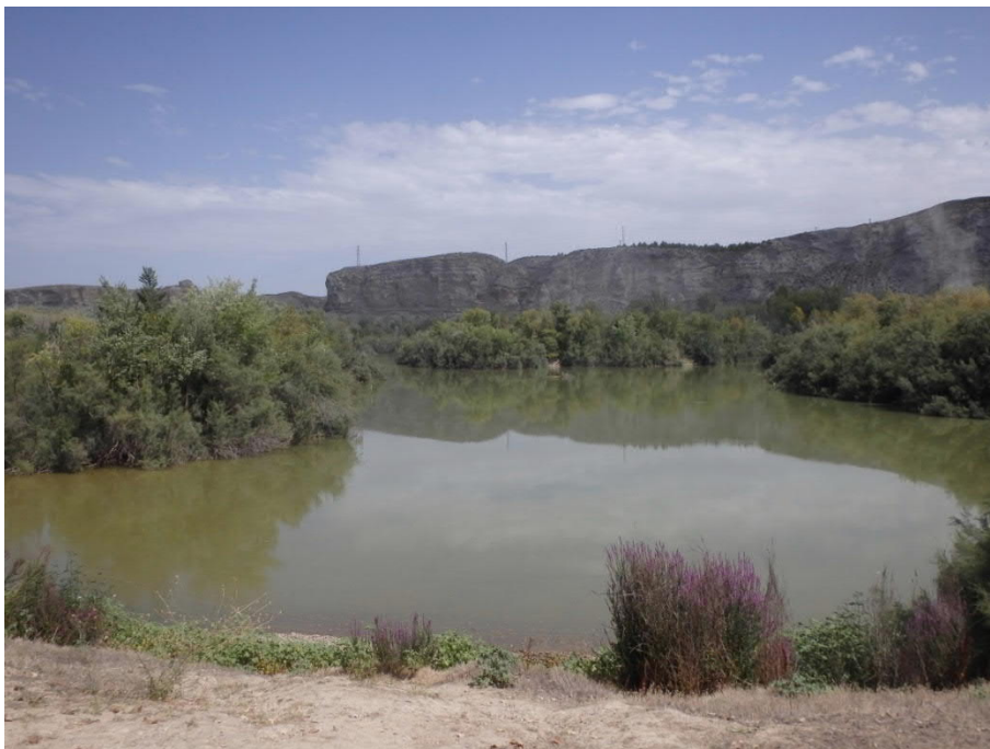
Vista general de la laguna muestreada