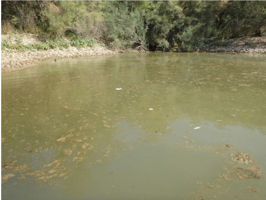
Color y aspecto del agua