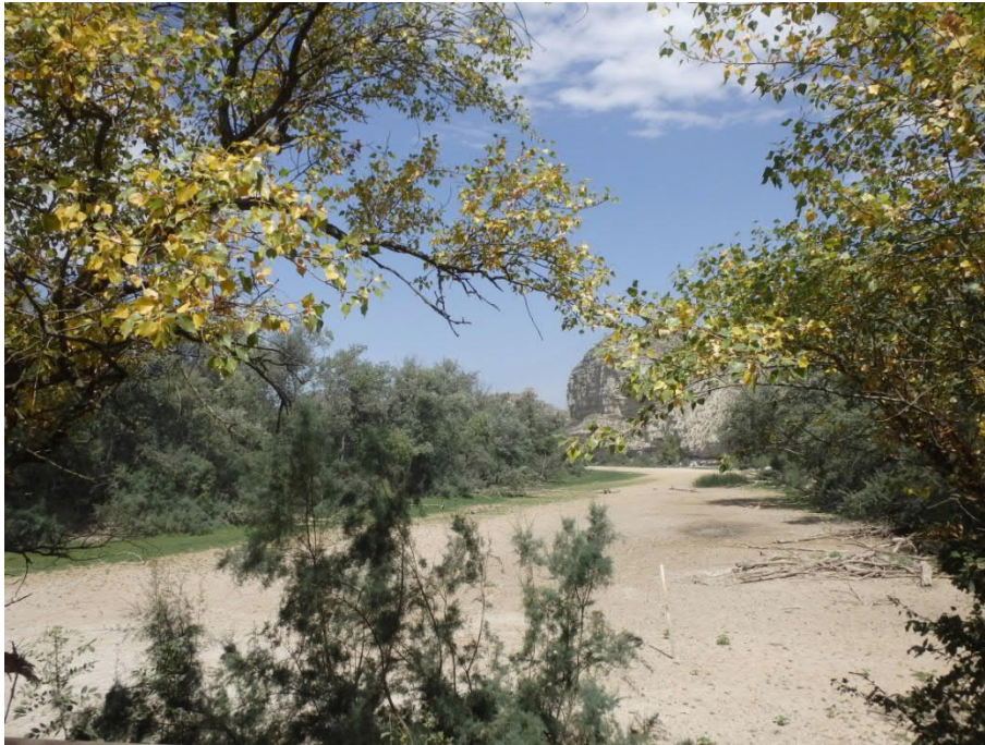
Vista general del Galacho de Juslibol seco