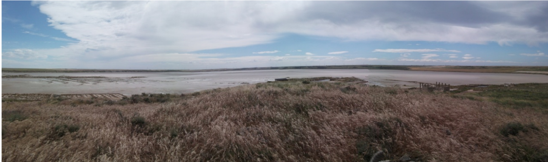
Vista panorámica de la laguna