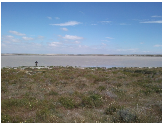
Vista del litoral con salicorniar en primer plano.