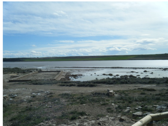
Imagen de las salinas situadas en la laguna