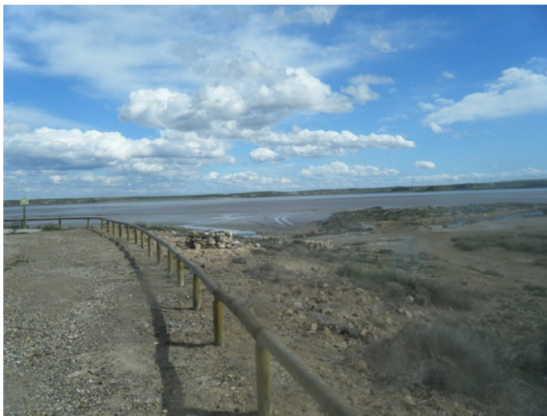
Vista de la laguna de La Playa