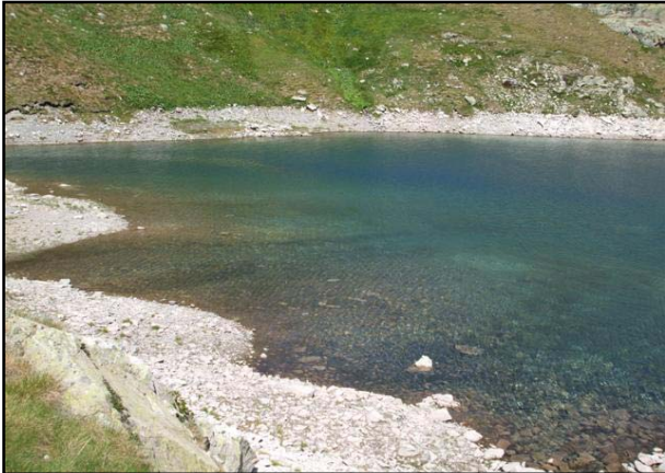
Vista de la zona litoral del lago