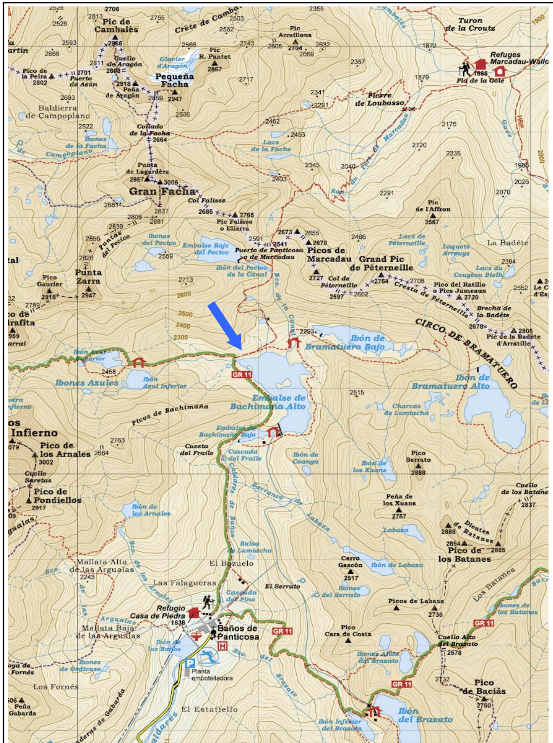
1- Embalse de Bachimana Alto