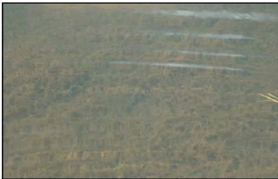
Nitella cf. flexilis