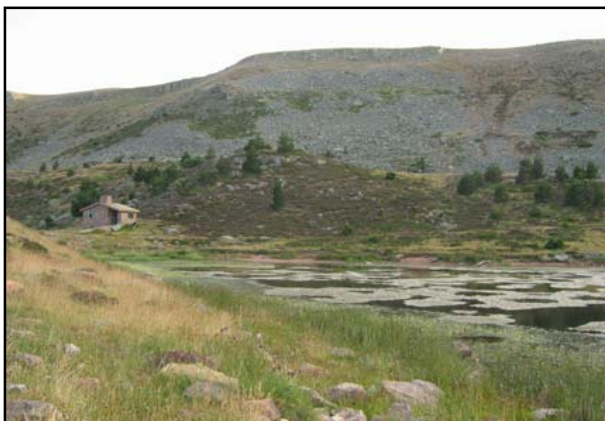
Inmueble en los alrededores de la laguna