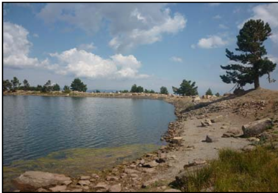
Vista de la zona litoral de la laguna en 2009