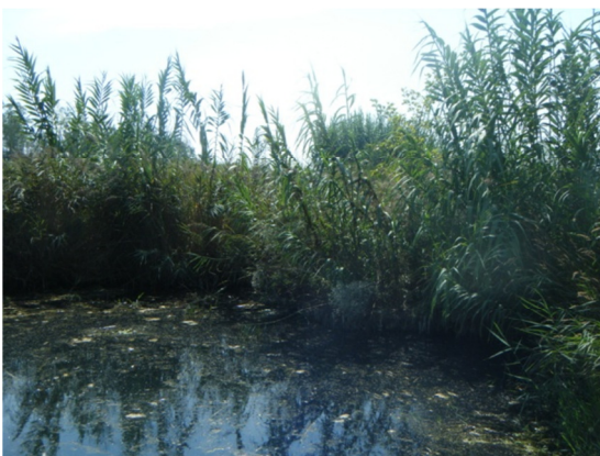
Turbidez por restos vegetales en superficie.