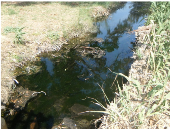
Canal de drenaje.