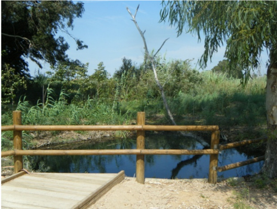
Infraestructuras en el litoral de uno de los "ullals".