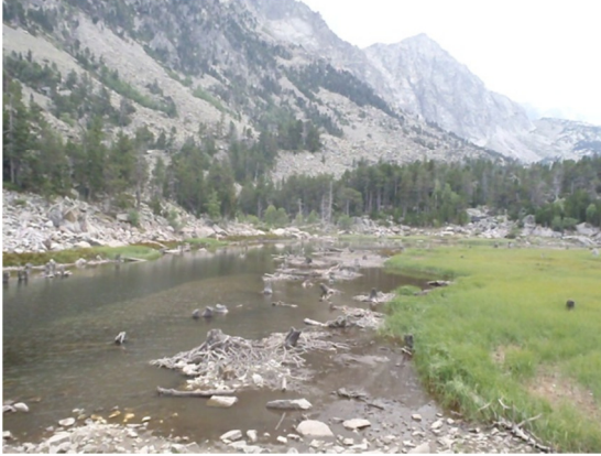
Vista general del lago.