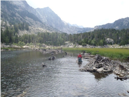
Muestreo invertebrados bentónicos.