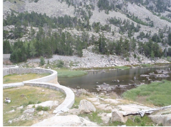
Vista del lago desde la presa.