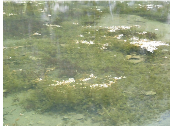
Vista del fondo con hidrófitos.